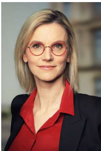
Agnès Pannier-Runacher, ministre de la Transition énergétique